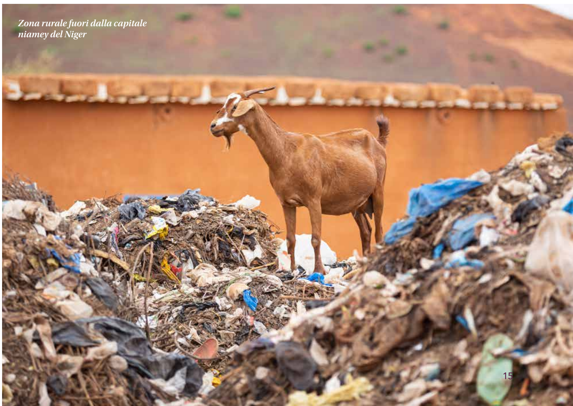
Zona rurale fuori dalla capitale niamey del Niger

Noi nascondiamo la morte. La pandemia, come i migranti, ci ha messo di fronte a qualcosa che noi non vogliamo vedere, la necessità di morire, lo scandalo della morte. Invece per queste persone è la normalità.